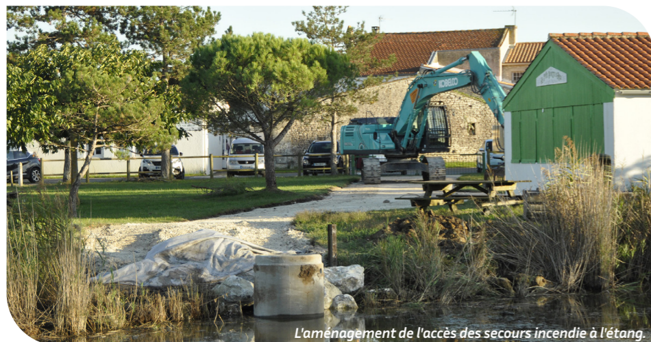
L'aménagement de l'accès des secours incendie à l'étang.

d'une bâche contenant plusieurs centaines de litres d'eau positionnée à la sortie d'Arceau direction les Allards, d'effectuer des travaux d'accessibilité sur la Maratte pour faciliter l'accès et les manœuvres de pompage de l'eau de l'étang en cas de nécessité par les services de secours. Ces travaux ont été intégralement pris en charge par la commune, l'amicale n'a donc engagé aucun frais. En conséquence, et comme indiqué dans le règlement intérieur, il est interdit de stationner sur cet accès, le stationnement s'effectuant sur le parking adjacent au local. Nous comptons donc sur votre civisme pour laisser cet espace vacant.