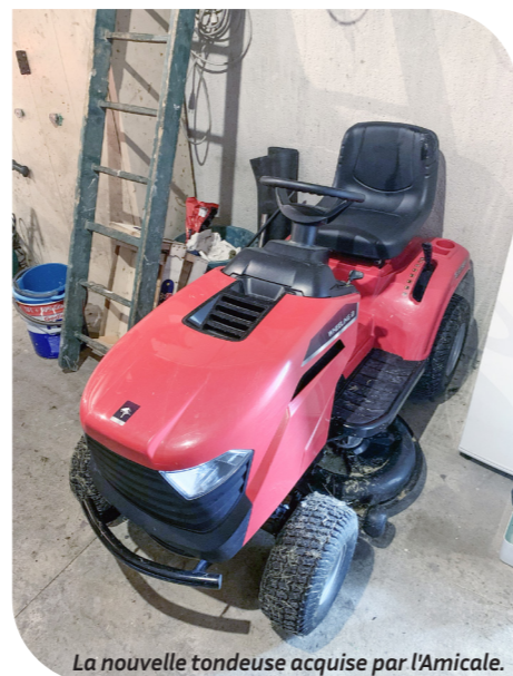
La nouvelle tondeuse acquise par l'Amicale.