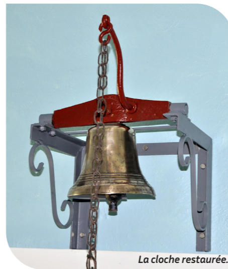
La cloche restaurée.

L es ex-écolier(e)s du village se souviennent sans doute de la cloche qui ornait l'école d'Arceau (aujourd'hui salle municipale). L'école n'est plus, mais sa cloche lui a survécu ! Restaurée cet hiver, elle a retrouvé sa belle teinte bronze et orne dorénavant le local de l'Amicale !