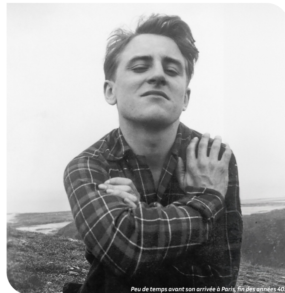
Peu de temps avant son arrivée à Paris, fin des années 40.

Pierre Bergé restera dans les mémoires comme un homme de conviction, dont l'impact se fera sentir bien au-delà de son époque.