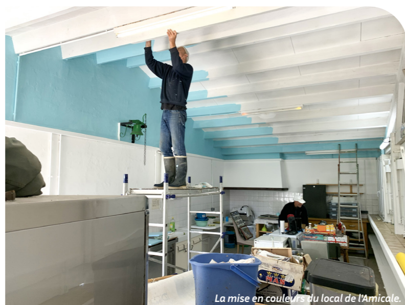
La mise en couleurs du local de l'Amicale.