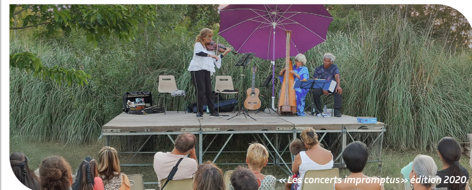
« Les concerts impromptus » édition 2020.

Pour la plupart des manifestations, vous aurez la possibilité de venir vous désaltérer et grignoter à la buvette où nous vous proposerons un assortiment de boissons ainsi que de la petite restauration.